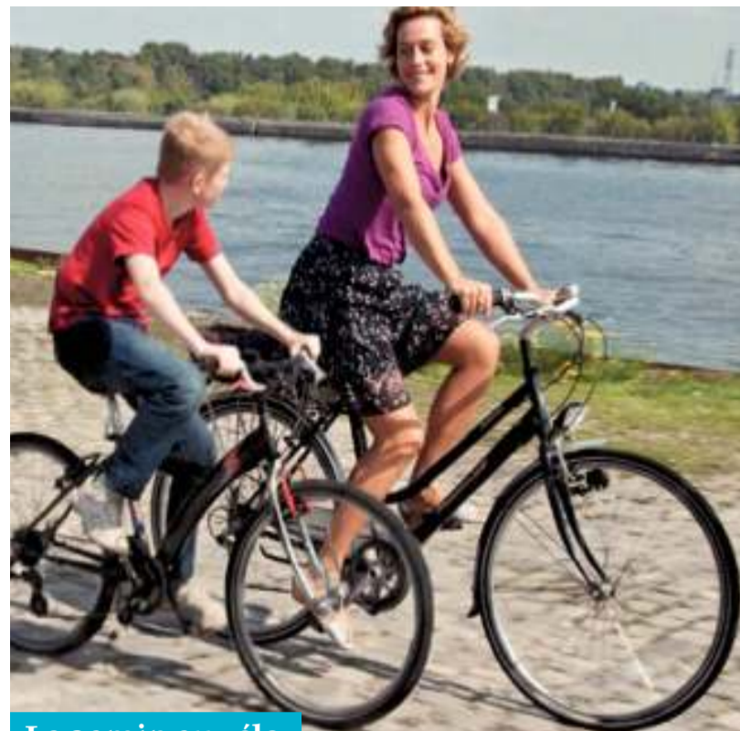
Le gamin au vélo