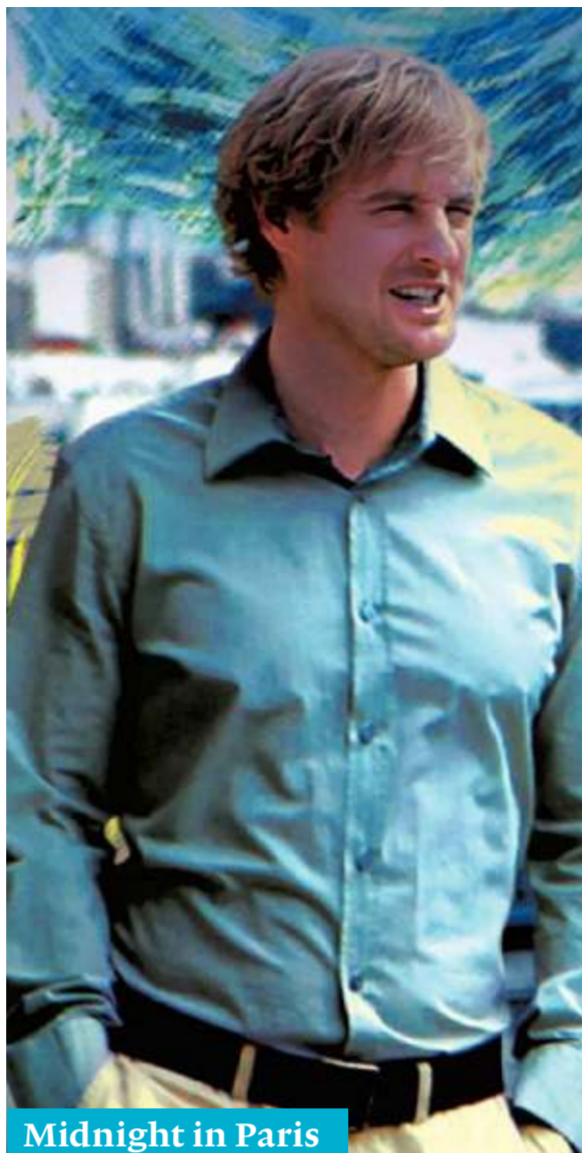
Midnight in Paris