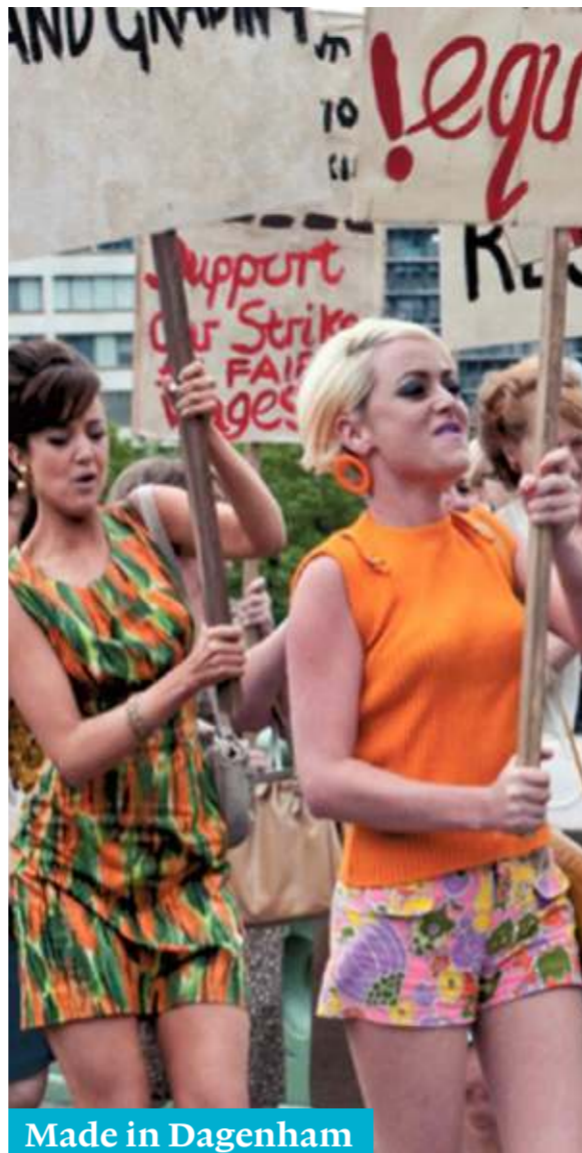
Made in Dagenham